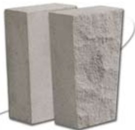
Clefs de Voûte