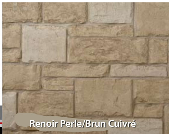
Renoir Perle/Brun Cuivré