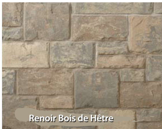
Renoir Bois de Hêtre