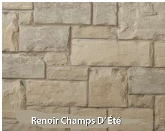
Renoir Champs D'Été